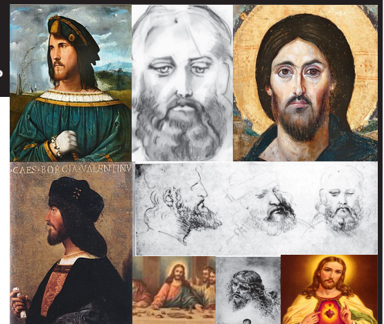
CESARE BORGIA + LEONARDO DA VINCI = IMAGEN D BESTIA - SKETCH DI CESARE BORGIA TRAHA PA LEONARDO DA VINCI

2 Korintionan 11:4 "Pasobra si un hende bin I prediká un otro Jesus ku nos no a prediká, òf boso risibi un otro spiritu ku boso no a risibi, òf un otro evangelio ku boso no a aseptá, anto boso ta tolerá esaki hopi bon mes."